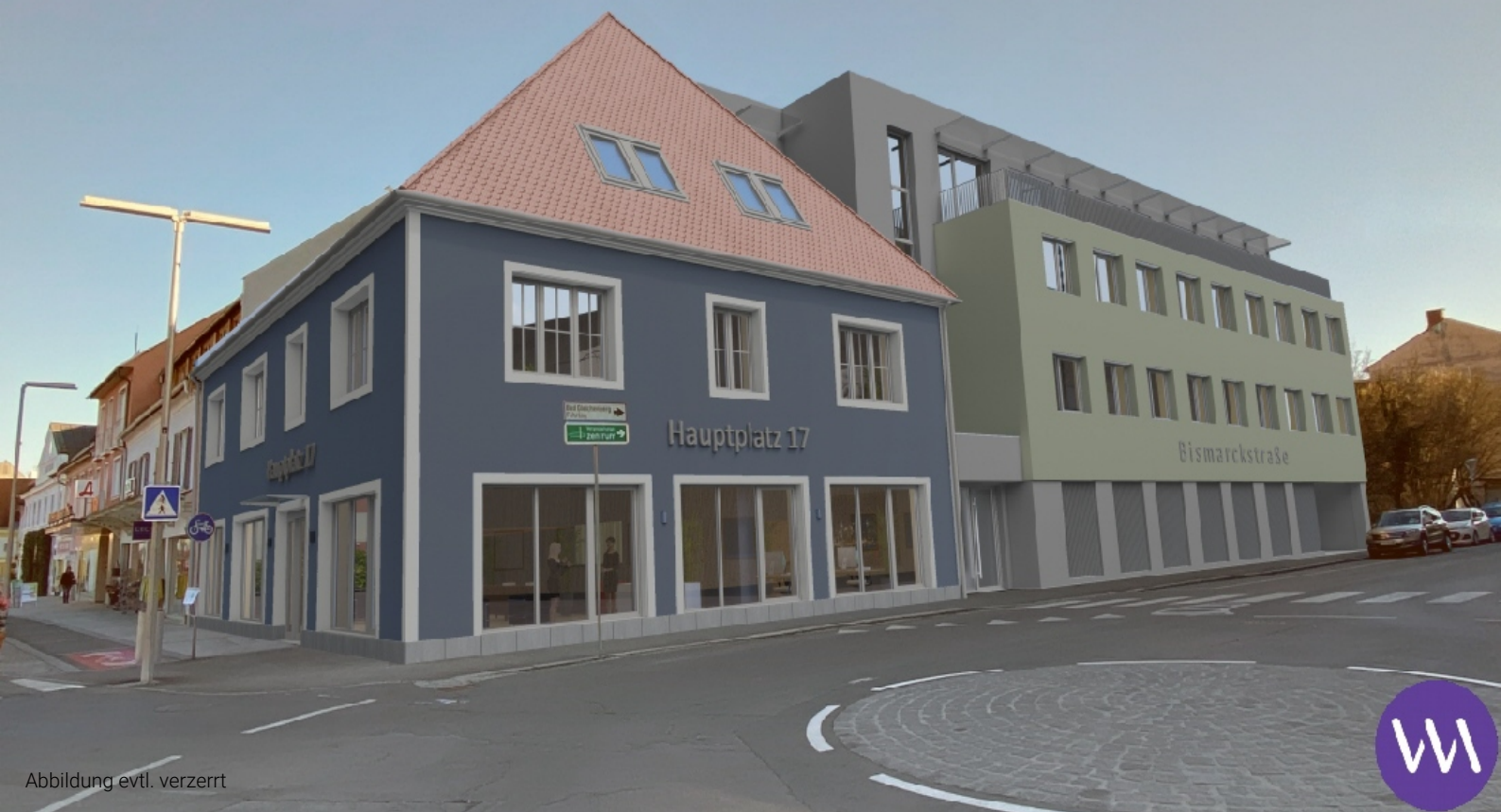
Abbildung evtl. verzerrt