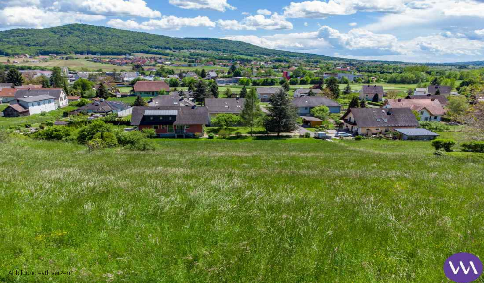
Abbildung evtl. verzerrt